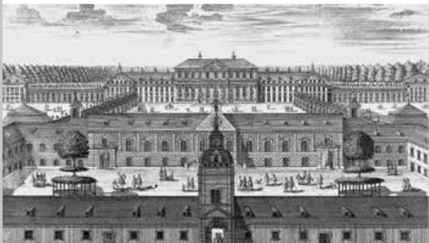
Altes und Neues Schloss Schleißheim, Kupferstich nach Mathias Disel, um 1722

Das Alte Schloss ist die Urzelle der ausgreifenden Schleißheimer Schlossanlage. Herzog Wilhelm V. von Bayern (reg. 1579–1598) erwarb ab 1595 mehrere Schwaigen mit neun Klausen und Kapellen und erweiterte diese 1598 bis 1600 um ein bescheidenes Herrenhaus. Herzog Maximilian I. (reg. 1598–1651) ersetzte die Eremitage seines Vaters ab 1617 durch einen anspruchsvollen Neubau nach dem Vorbild moderner oberitalienischer Villenarchitektur der Spätrenaissance. Im Zweiten Weltkrieg wurde das Alte Schloss mit seiner prunkvollen Innenausstattung tiefgreifend zerstört. 1971/72 wiederaufgebaut, beherbergt es heute unter dem Titel »Das Gottesjahr und seine Feste« die über 6000 Objekte umfassende volkskundliche Sammlung Gertrud Weinhold zur religiösen Fest- und Alltagskultur der Völker sowie eine Ausstellung zur Landeskunde Ost- und Westpreußens als Zweigmuseen des Bayerischen Nationalmuseums.