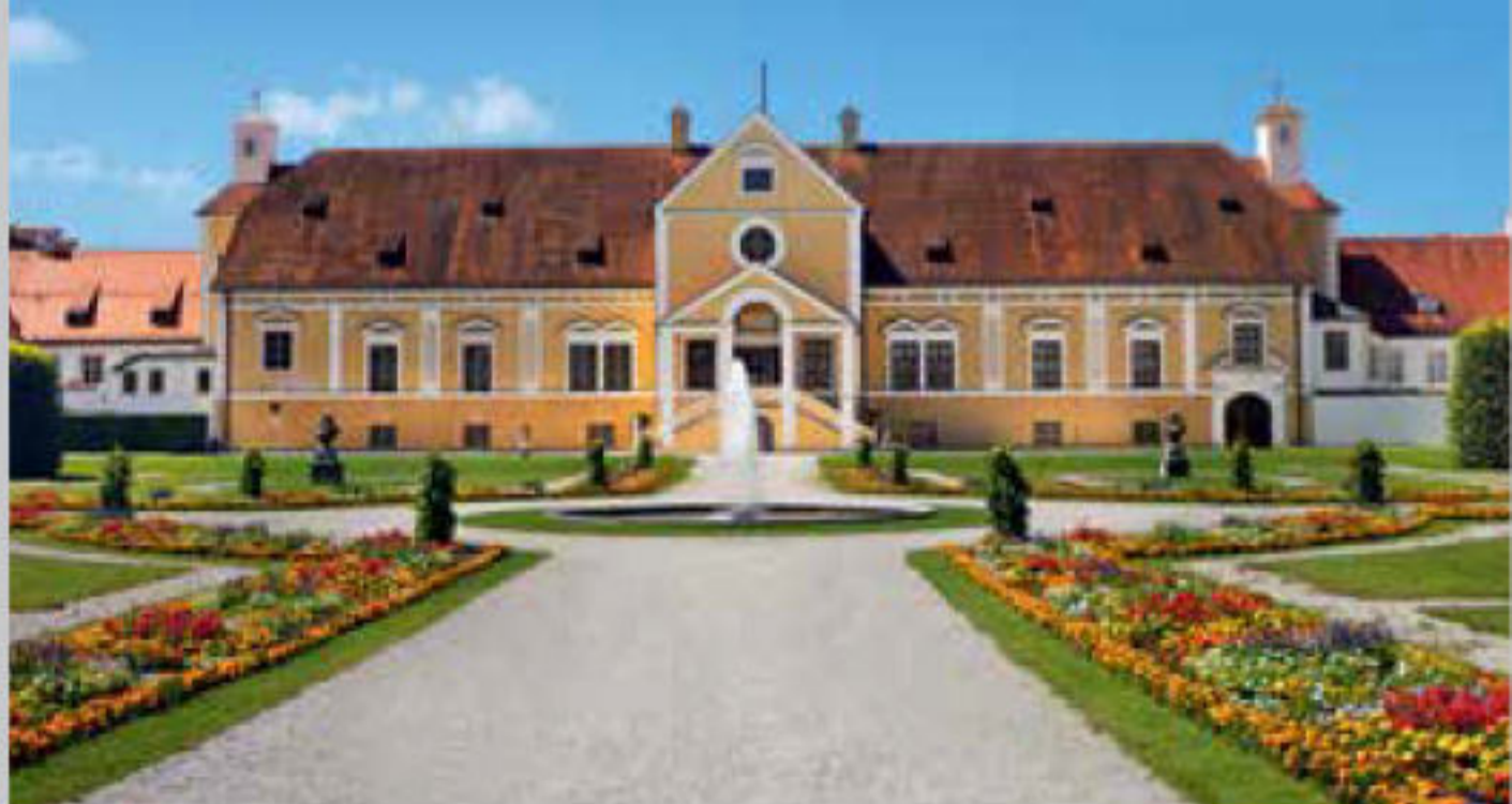
Altes Schloss Schleißheim