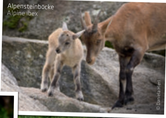
Alpensteinböcke Alpine ibex

Come to Hellabrunn Zoo and discover the excitement and wonder of the animal kingdom. Here, exotic and native species live in continent-themed zones, with animals from the same continent residing together in natural communities or in neighbouring enclosures. Whether iridescent, shaggy, spotted or striped – there is always something new to discover at Hellabrunn Zoo.