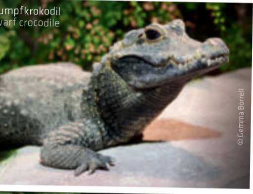
Umpfkrokodil Nile crocodile