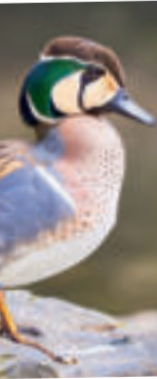
Baikalente Baikal teal