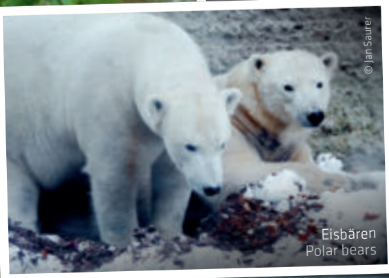
Eisbären Polar bears